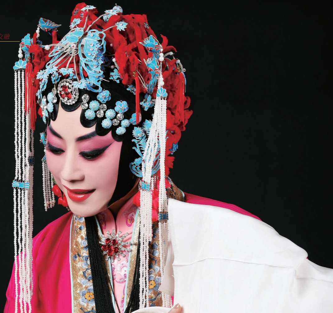
李佩红 | (饰 薛湘灵)

上海戏剧学院戏曲学院院长、硕士研究生导师，教授、国家一级演员，首批终身享受国务院特殊津贴。曾获全国京剧新剧目汇演最佳表演奖、全国青年京剧演员电视大赛金奖、中国戏剧梅花奖和上海戏剧白玉兰奖。